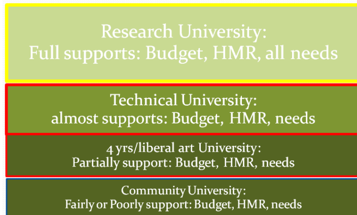
รูปที่ 1 รูปแบบของมหาวิทยาลัยในแผนยุทธศาสตร์อุดมศึกษาฉบับ 2

ตามแผนยุทธศาสตร์อุดมศึกษาฉบับที่ 2 จะแบ่งมหาวิทยาลัยออกเป็น 4 แบบ ก คือ วิทยาลัยชุมชน แบบ ข คือ มหาวิทยาลัยราชภัฏ แบบ ค คือ มหาวิทยาลัยราชชมงคล และมหาวิทยาลัยรัฐ แบบ ง คือ มหาวิทยาลัยวิจัย (รูปที่ 1) ซึ่งมหาวิทยาลัยวิจัยจะได้รับการสนับสนุนจากรัฐบาลเต็มที่ ขณะที่มหาวิทยาลัยในแบบชั้นต่างๆ ลงมาจะได้รับการสนับสนุนน้อยลงมาเป็นลำดับ